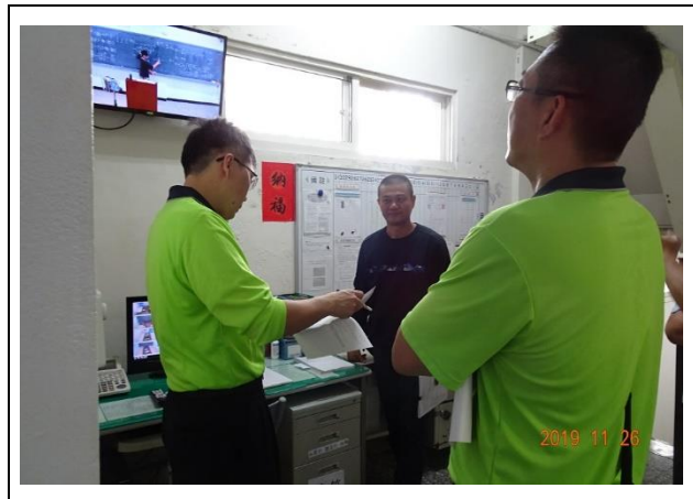
檢視系統傳輸教學情況