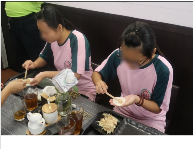
同學們體驗包饺子