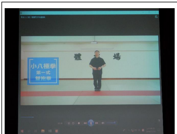
教官以影片教學小八極拳招式