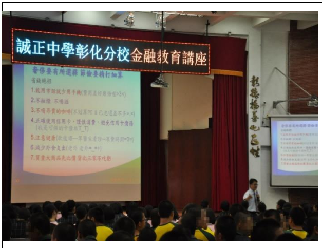
教導學生使用金錢的正確觀念