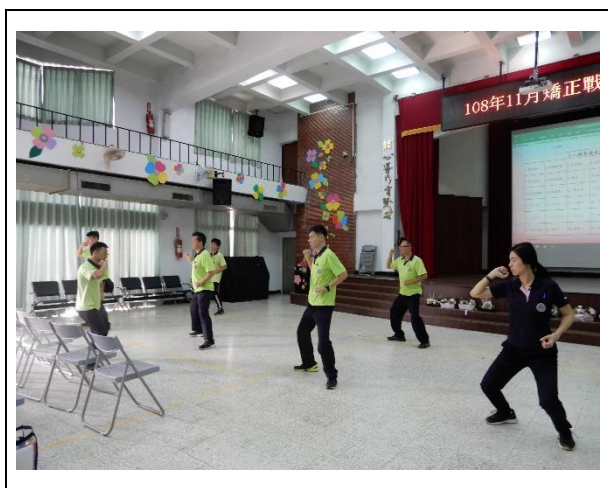
教官教學八極拳招式