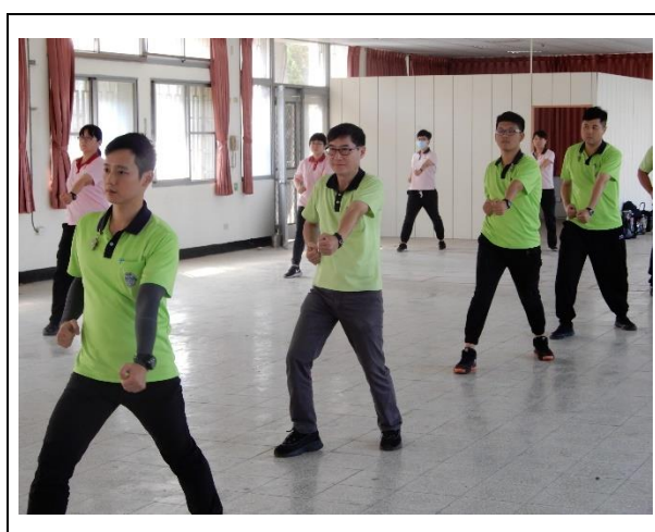
教官教導小八極拳-馬步捶