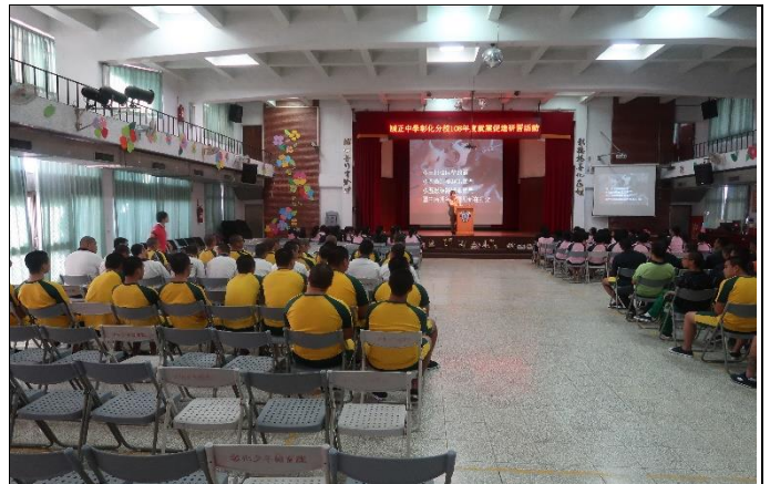
現場同學認真聽講