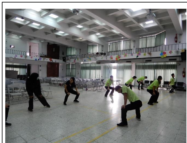
教官教導如何熱身