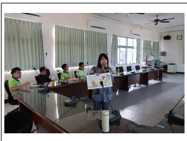
分享同理心繪本故事