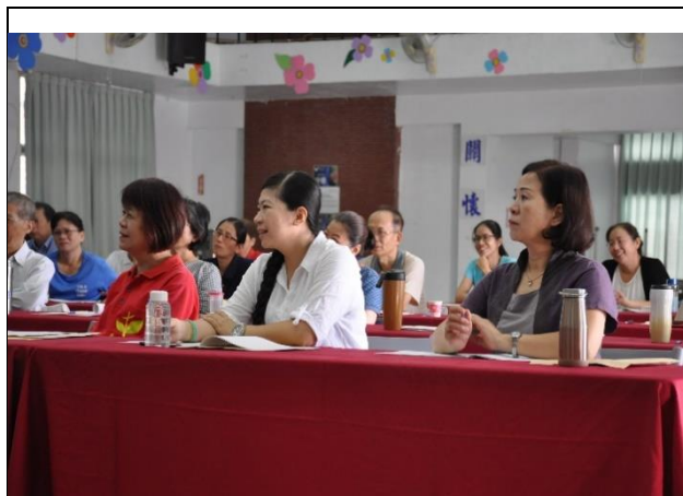
學員與講座互動熱絡