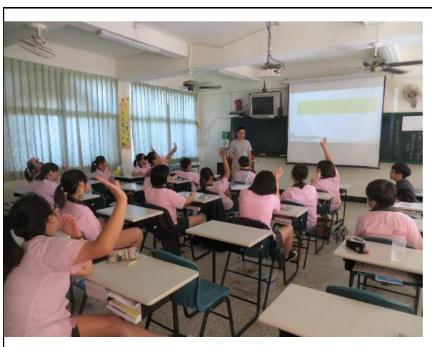
與同學互動式提問