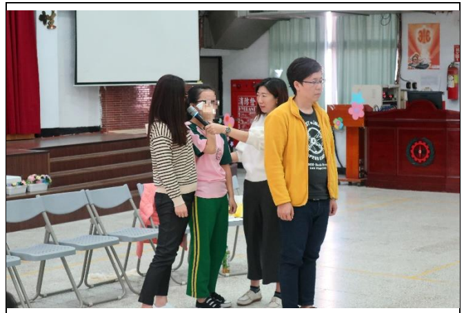
家族系統排列-面對困境及家庭支持