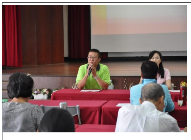
江科長回應志工提問