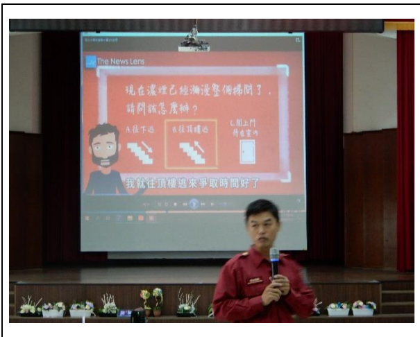
火場逃生-濃煙密布時，關上門才對