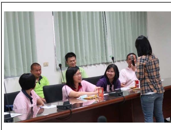
與同仁互動，創造輕鬆活潑氣氛