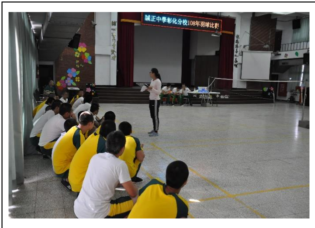
體育老師說明比賽規則