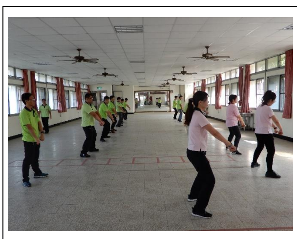
教官教導小八極拳-雙栽捶