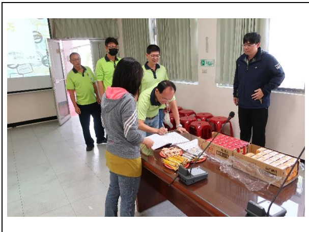
同仁依序簽到入場