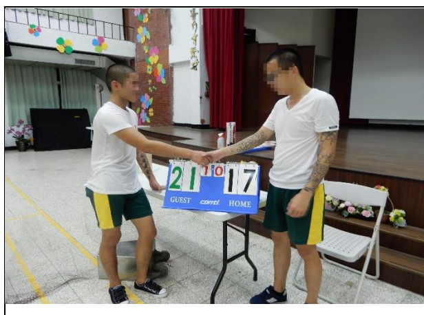
男生組最後以 21 比 17 奪冠