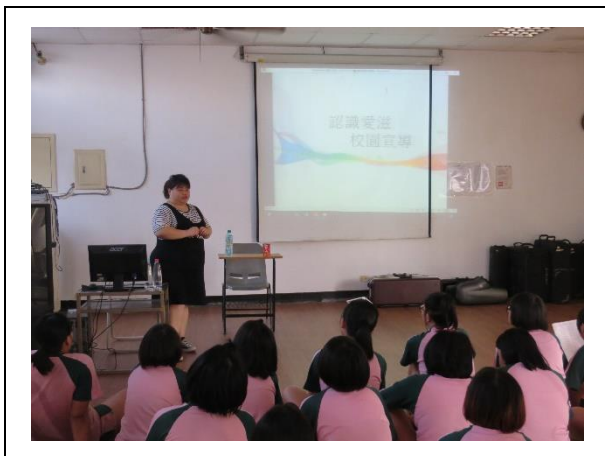
認識愛滋校園宣導