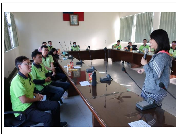
與同仁示範如何溝通