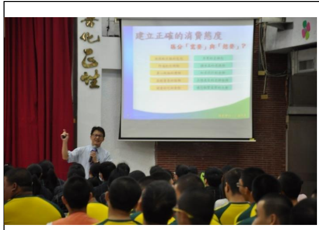
讓學生區分「想要」與「需要」的差異