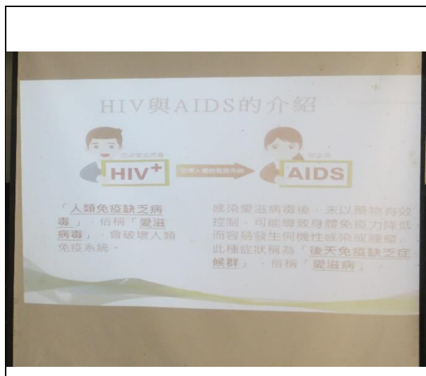
HIV 與 AIDS 的介紹