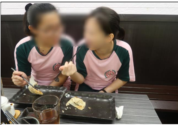
同學們吃的津津有味