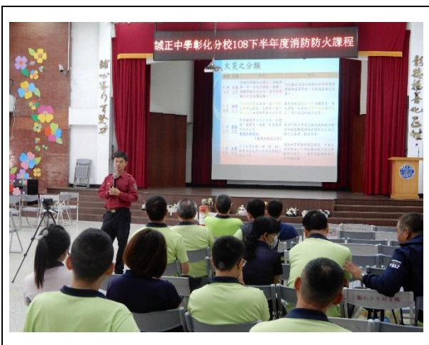
滅火器使用及各種類型火災說明