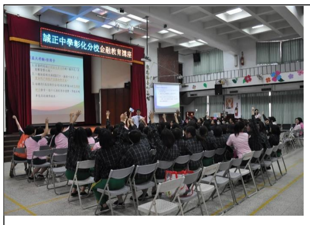
講座與學生互動熱絡