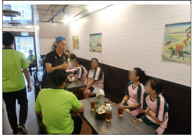
田老師與同學互動