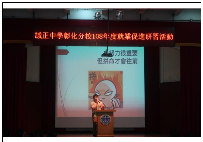
彭講師勉勵同學要努力且拼命實踐夢想