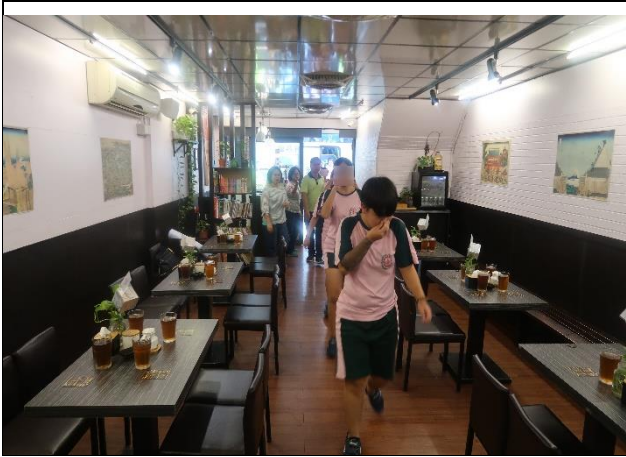
學生下車進入店內參訪