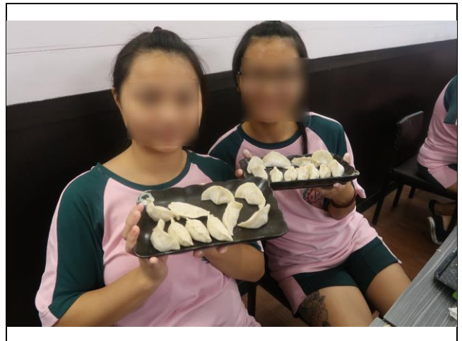
完成手工餃子的喜悅