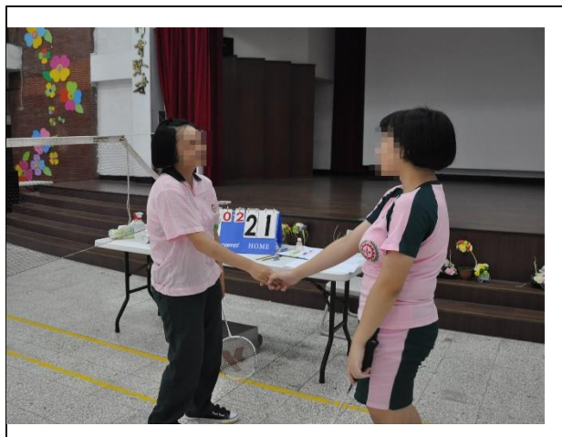
賽後雙方握手結束君子之爭