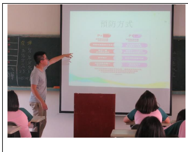
PEP 與 PrEP