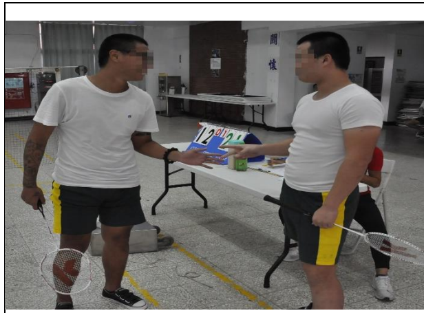
選手以猜拳決定選擇場地或發球權