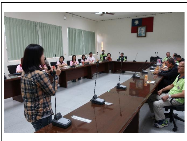
同仁聆聽演講內容