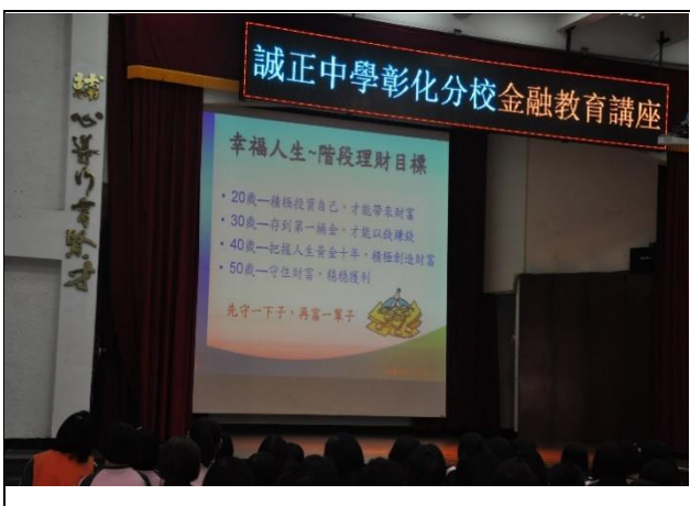
介紹幸福人生階段理財目標