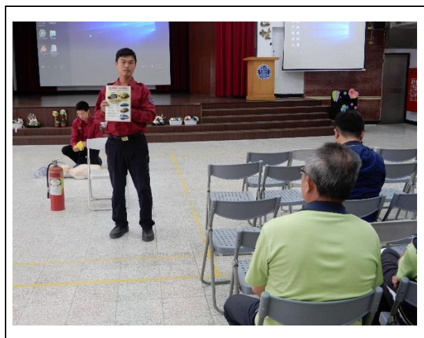
宣導救護車不是計程車