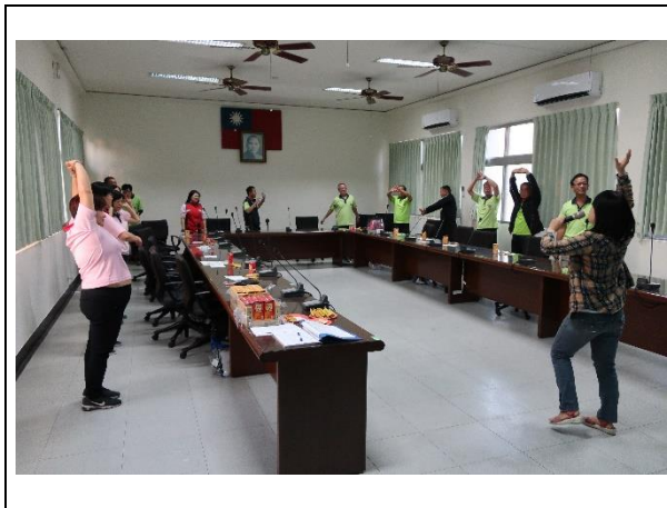
放鬆身心，準備進入課程內容