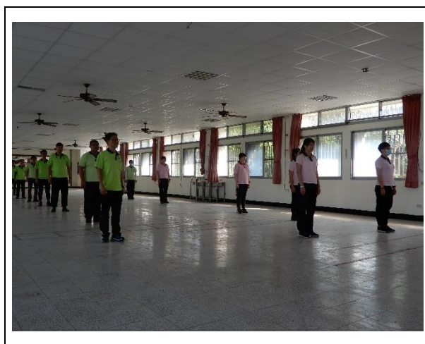
同仁聞教官喊小八極聲，肅立預備