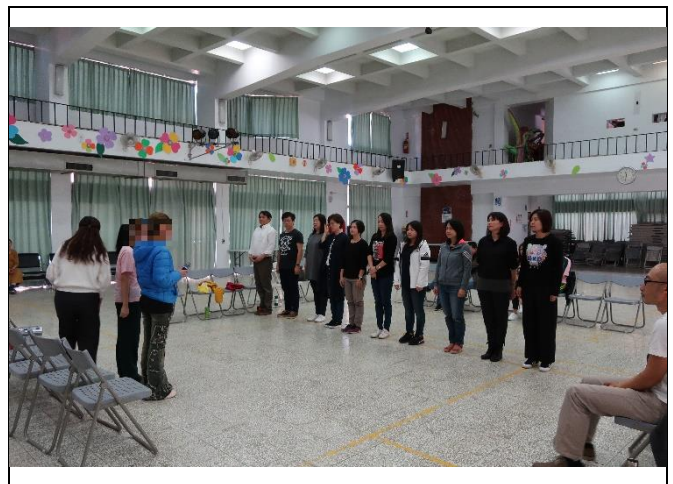
家族系統排列-面對困境及家庭支持