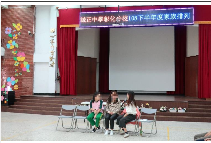
家族系統排列演示