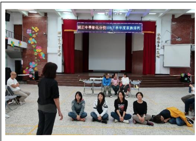
家族系統排列-面對困境及家庭支持