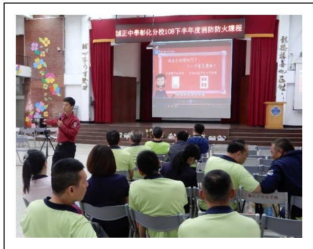
關上門後不要選廁所避難