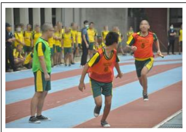
爭取榮譽奮力向前