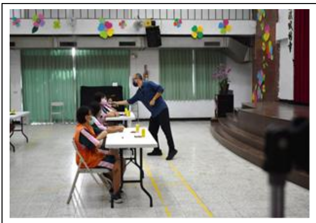
學生分享與家人衝突的故事