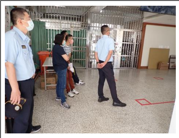
驗收本案播放情形