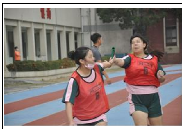
堅持不放棄跑完全程