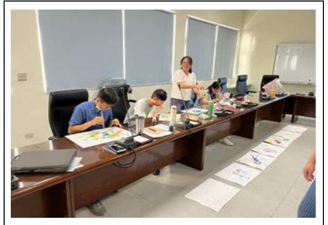
種子教師共同體驗課程內容