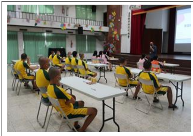
學生們專心聆聽講師分享