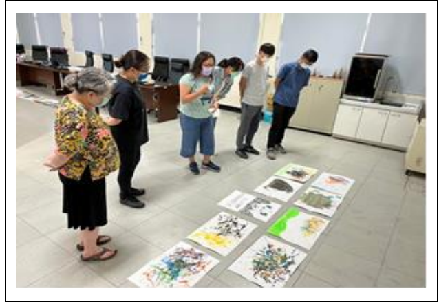
欣賞學生上課之作品