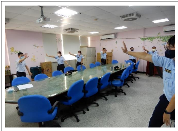
同仁團練手型 10 式