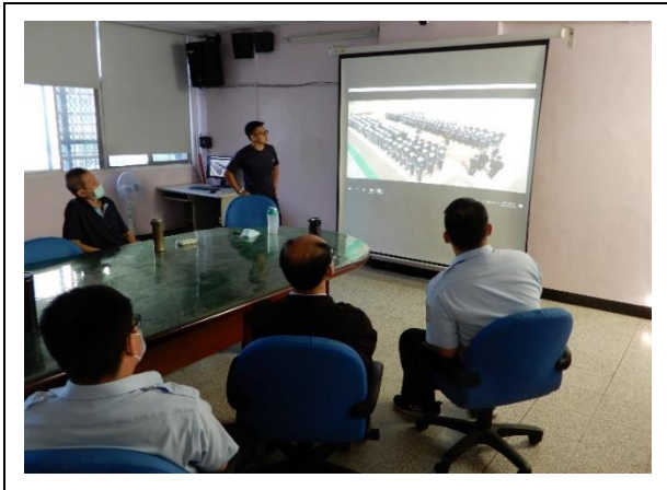
教官播放矯正署靖安成軍影片