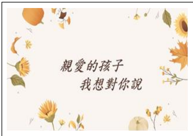
父母留言影片撥放