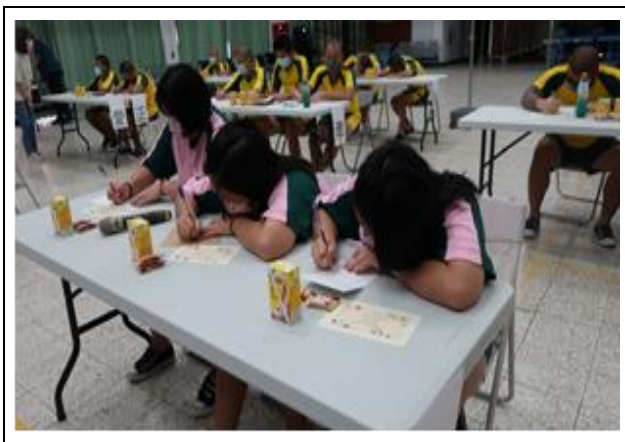
學生專心地將心裡的話寫進卡片