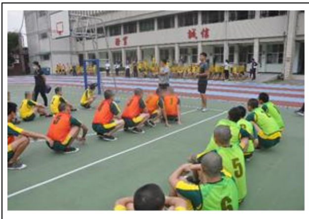
本校體育老師說明比賽規則