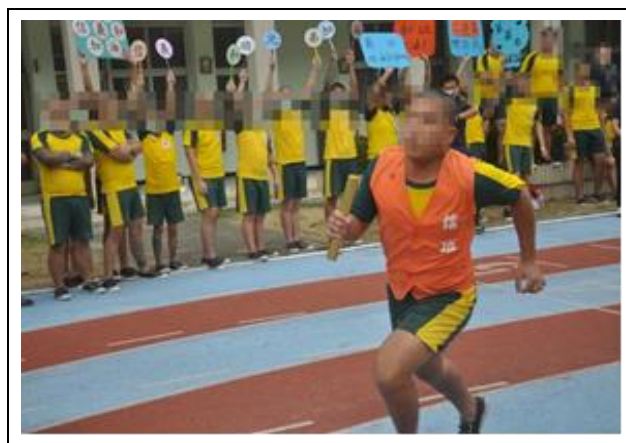
場外加油聲不絕於耳