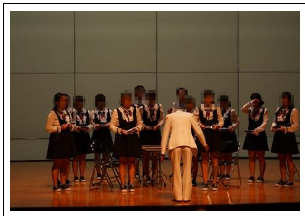
比賽結束學生感動落淚