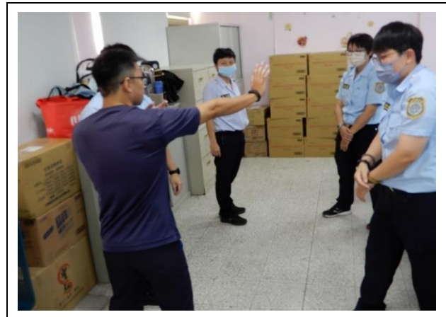
教官細部指導同仁動作