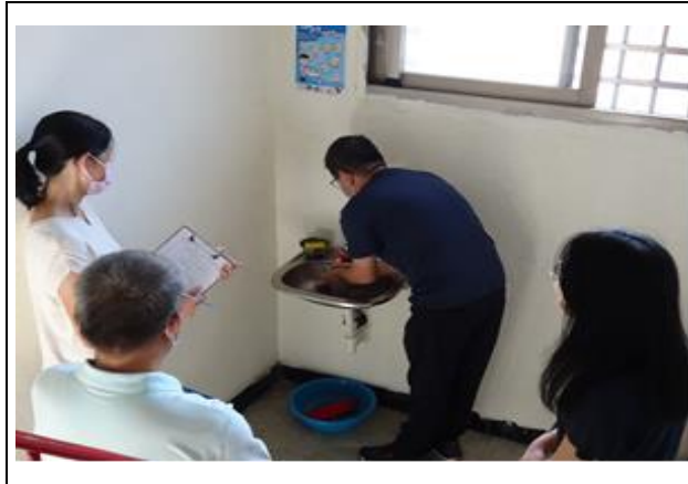
感染管制查核-實地訪查與提問