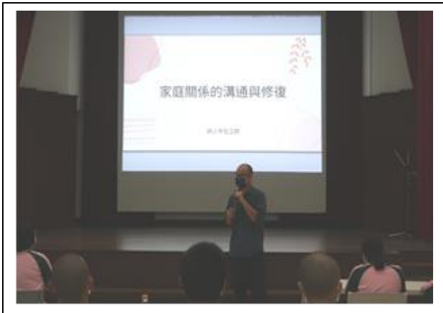
科學實證毒品處遇-溝通技巧講座