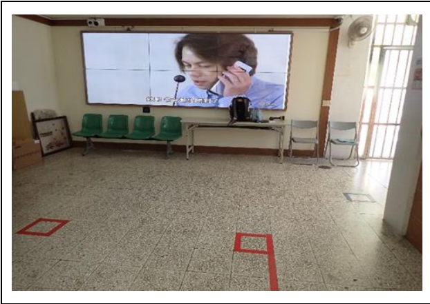
確認電視牆播放情形