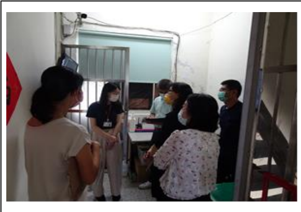
感染管制查核-實地訪查與提問