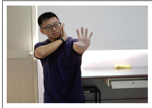
教官講解手型 10 式動作