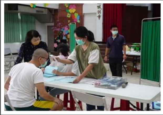
人員確認與體溫量測