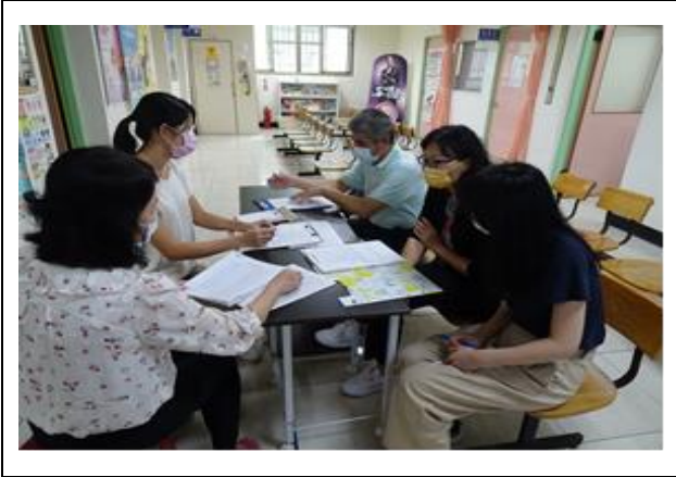
感染管制查核-資料檢視與說明