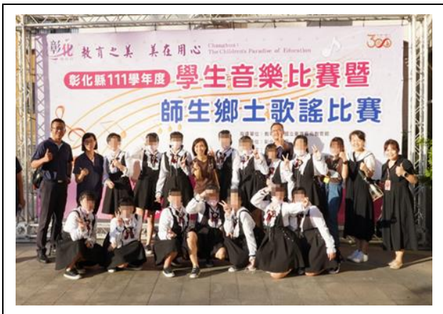
校長親赴現場為學生加油打氣