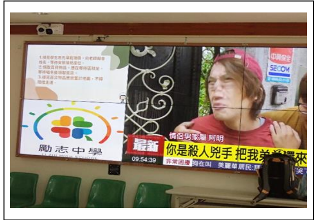
確認電視牆分割播放功能