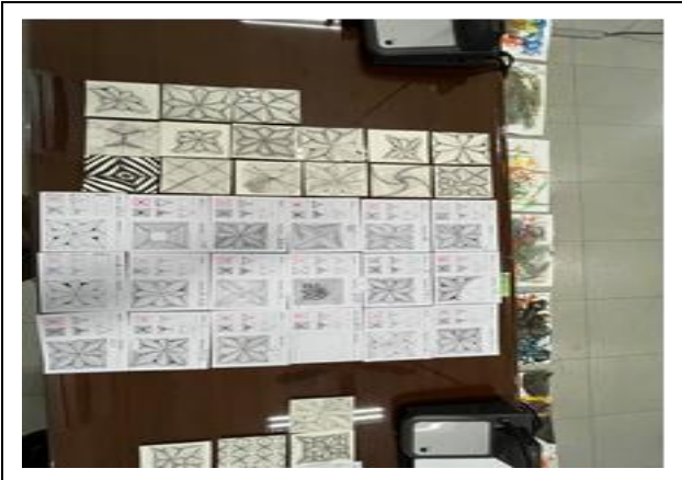
欣賞學生上課之作品