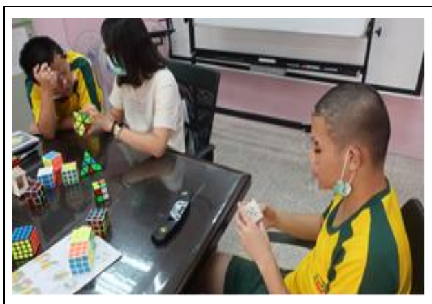
計時器練習與個別指導