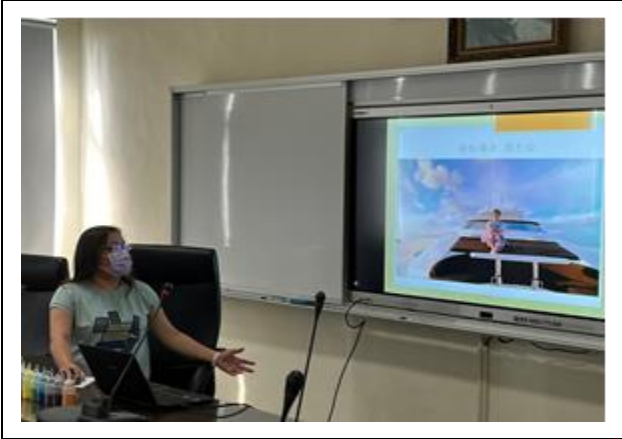
點亮老師分享授課內容