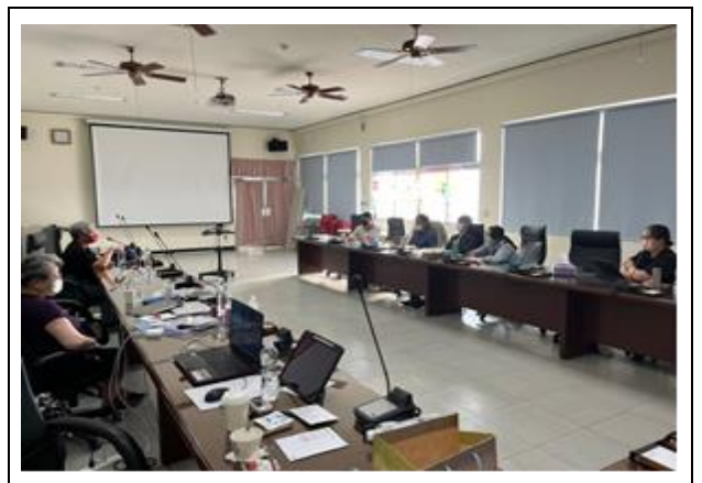
成員共同討論如何學生互動