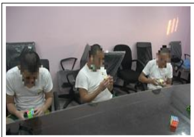
良性競爭，增進學習效能