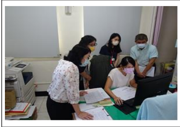
感染管制查核-資料檢視與說明