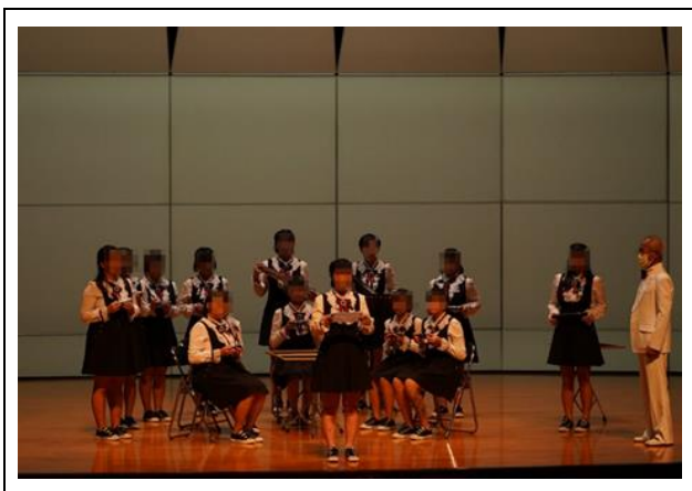
信, 給 15 歲的你」給孩子的一封信深情獨白