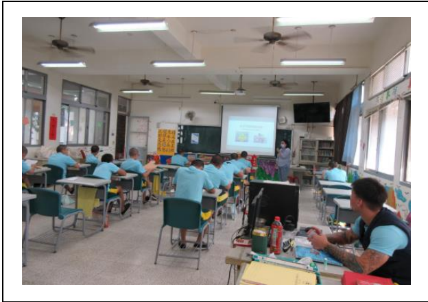
講師說明活動進行方式