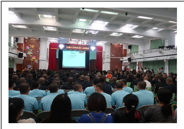
師生皆能專注聆聽講座