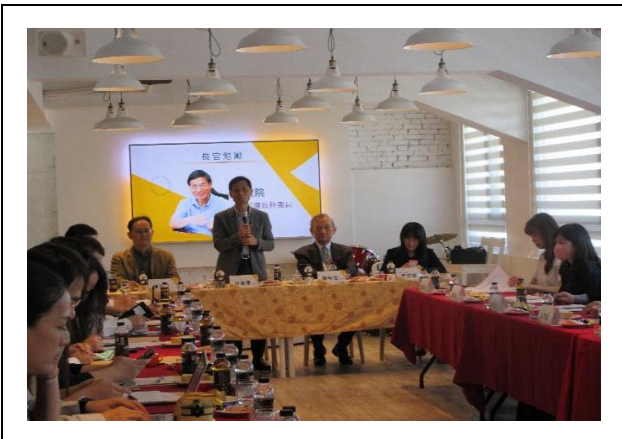
政務委員召集各部會進行討論會議