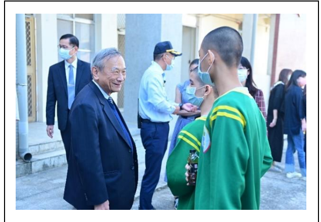
政務次長與學生互動