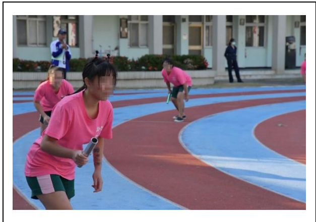
學生就起跑點預備