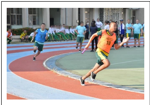
場外加油聲不絕於耳