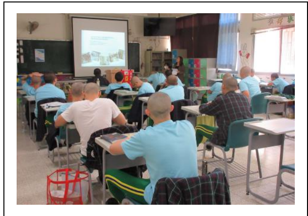
講師分享創業過程