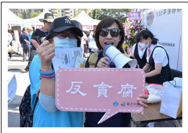
手沖咖啡宣導反貪腐