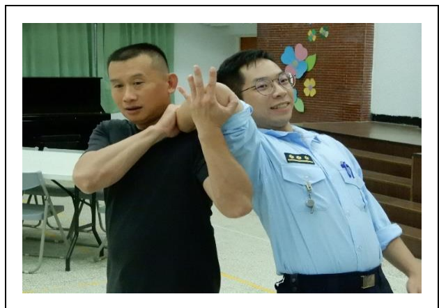
教官示範新式單人提帶姿勢