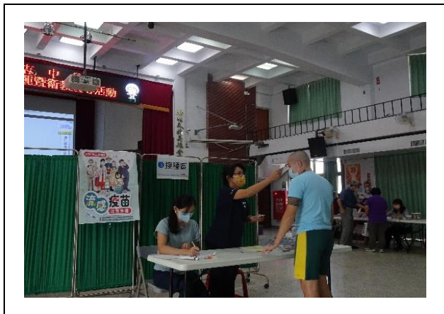
人員確認與體溫量測