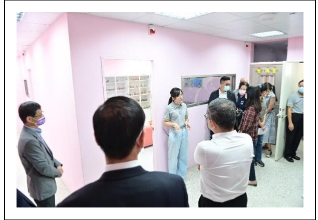
輔導主任介紹輔導空間