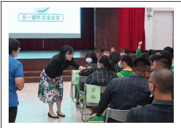
學生觀影後進行有獎問答