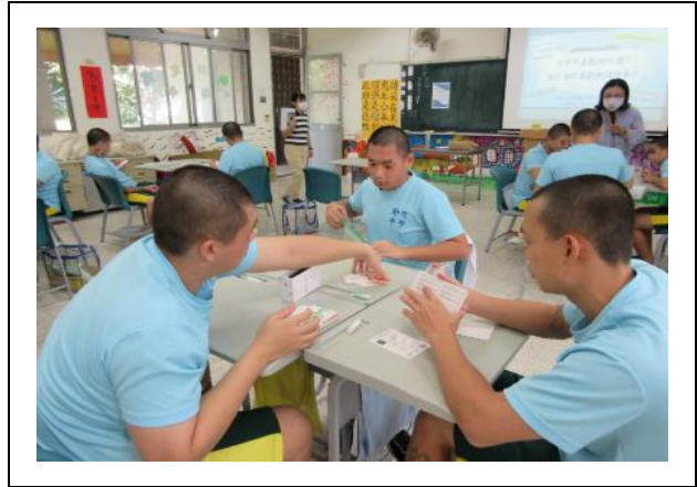
以小團體方式進行牌卡探索