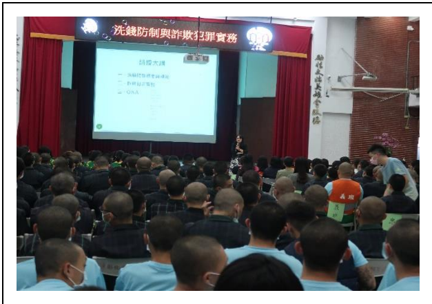
此次辦理地點為本校中正堂