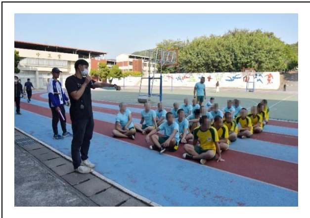
本校體育老師說明比賽規則