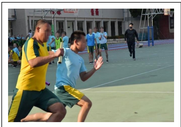
場內君子之爭場外維持良好風度