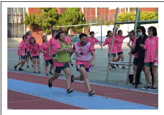
為班級爭取榮譽奮力向前