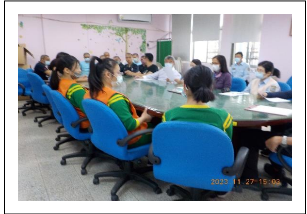
承辦單位報告相關宣達事項