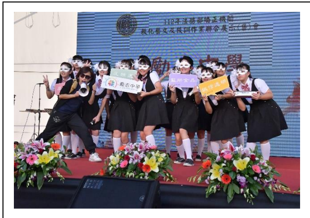
表演結束宣導「誠信透明、反貪腐 及反賄選」觀念