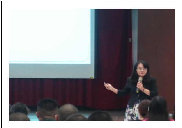
講師分享受騙實務