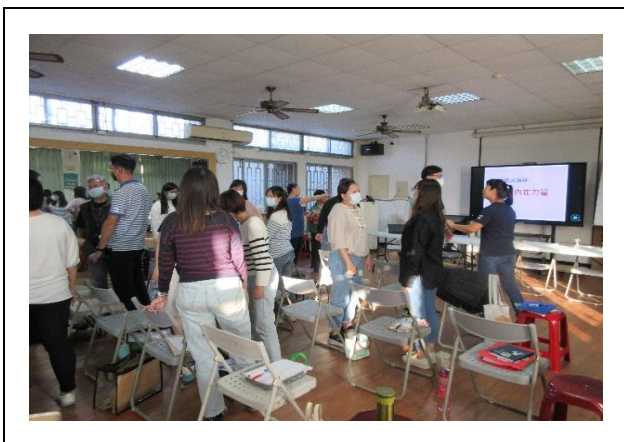
柯老師邀請全部職員一起練習