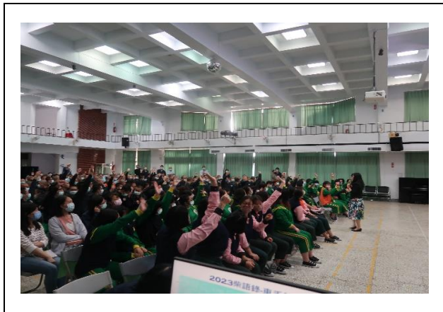
學生踴躍舉手發言