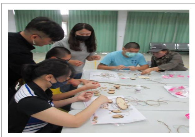
工作人員協助活動進行