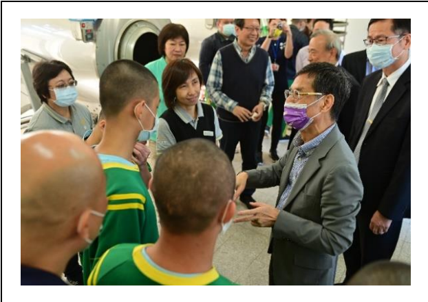
政務委員勉勵學生