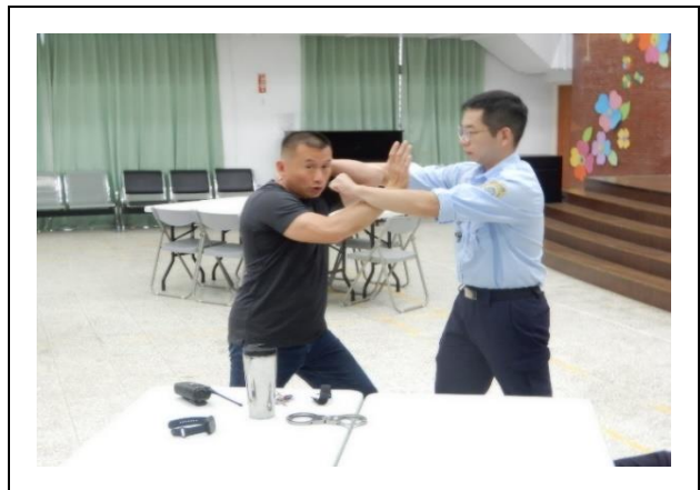
教官示範如何架檔