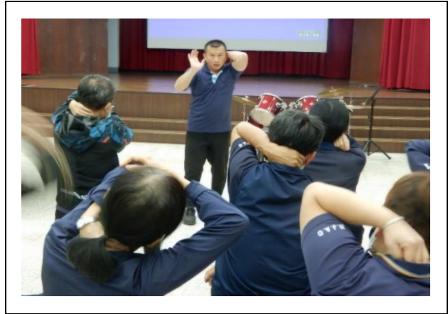
教官講解如何使用架檔姿勢