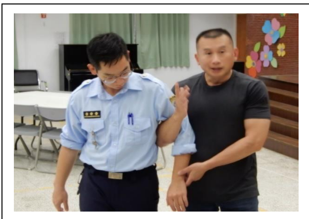
教官示範舊式單人提帶姿勢