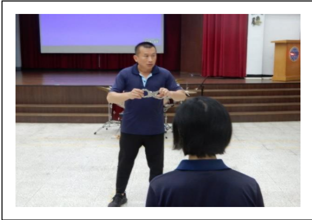
教官講解如何使用手銬