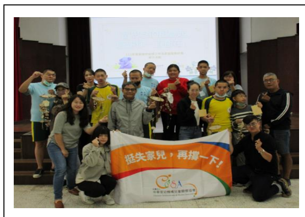
參與人員全體合影