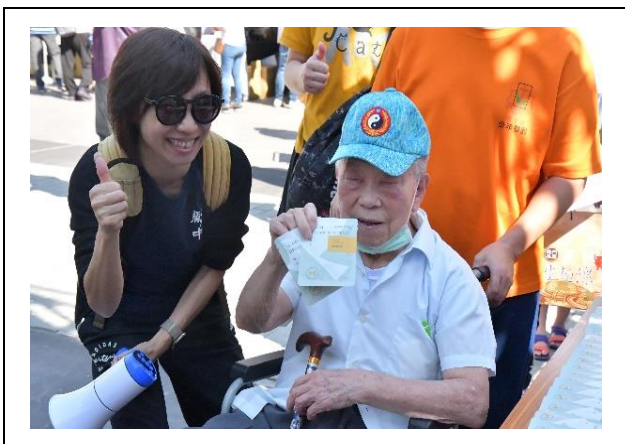
民眾遊戲闖關成功 開心獲勵志精品咖啡包