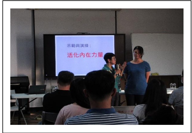
職員進行示範演練