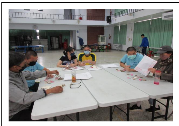
學生與家屬討論材料使用及分配