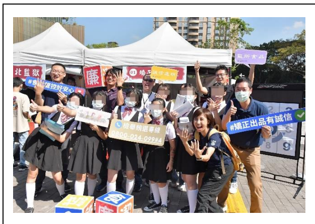
廉政宣導攤位前強化四大核心理念