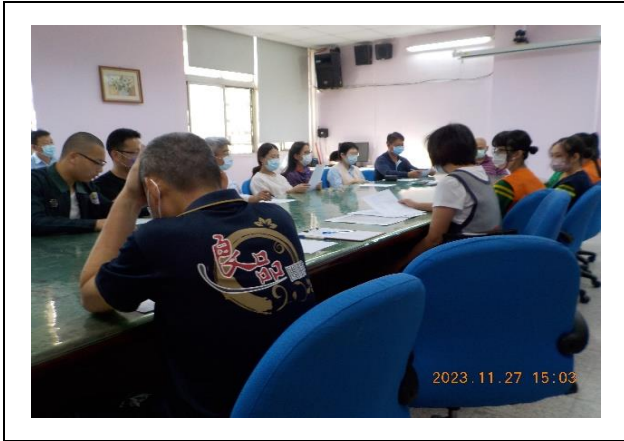
承辦單位報告上次會議意見反映執行情形