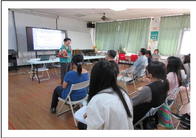
柯老師講授 NLP 核心概念