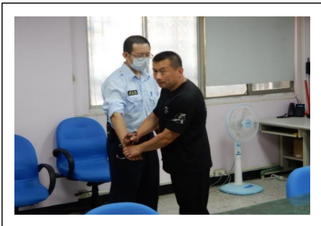
教官示範如何使用手銬