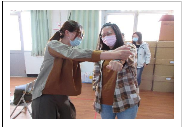
職員透過技巧演練增進自我覺察