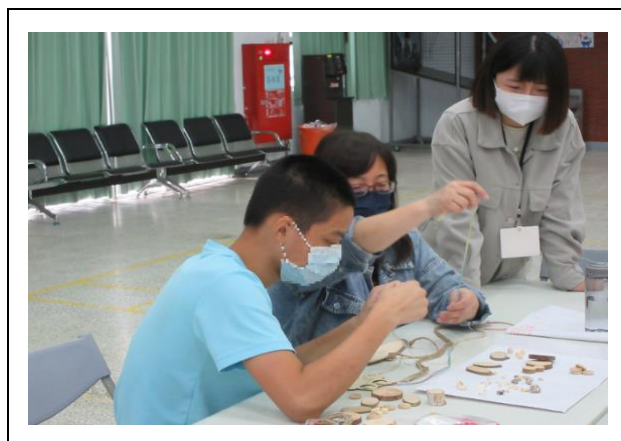
學生與重要他人一同創作