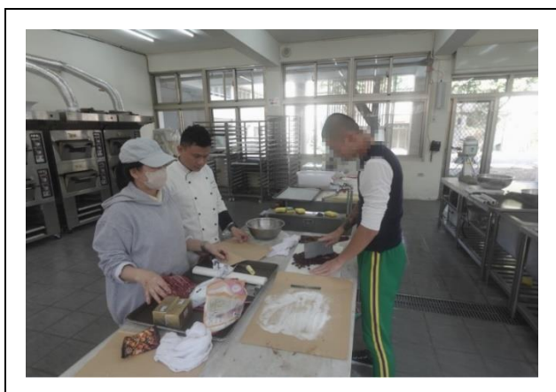
餐飲科教師帶領學生製作手工曲奇餅乾