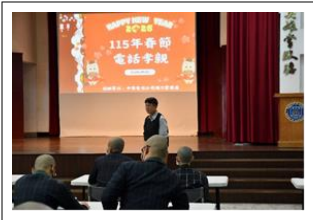
校長蒞臨現場關心學生