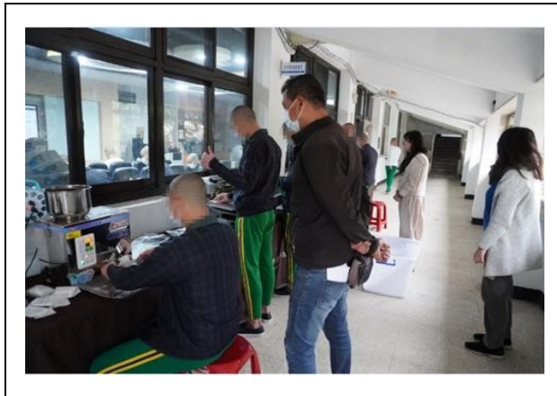
教務處同仁與學生合力包裝濾掛咖啡