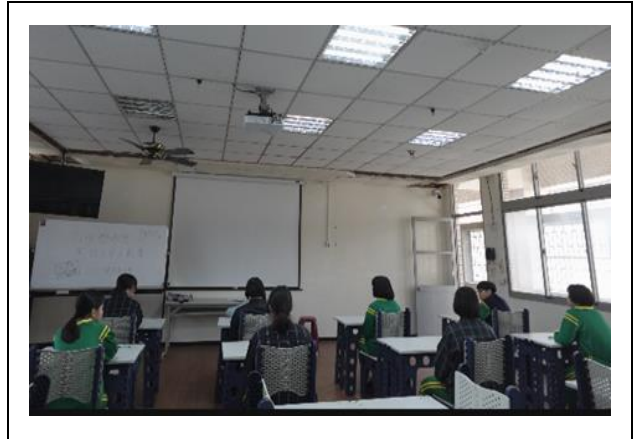
英文單字比賽-女生在靜思書軒