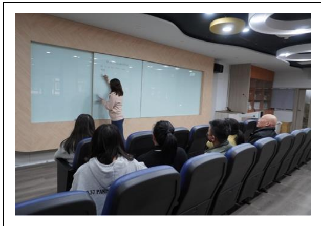
教務處主任進行禮盒數量報告及任務分工