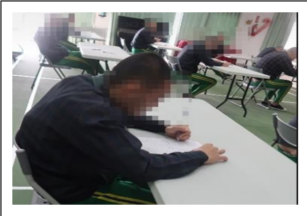
英文單字比賽-男生用心寫