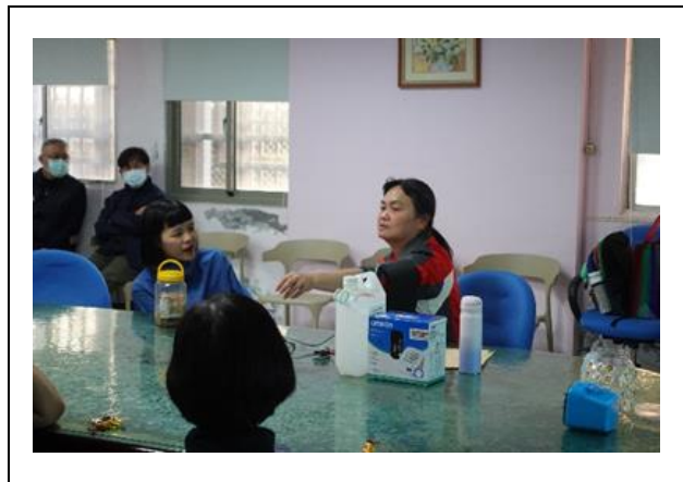
請本校護理師擔任教學工作