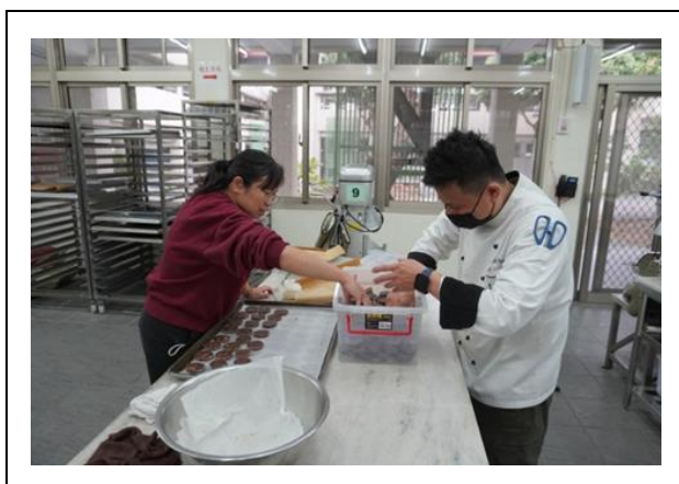
教務處同仁合力製作曲奇餅乾