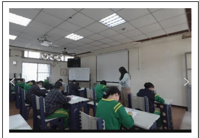
英文單字比賽-女生用心寫