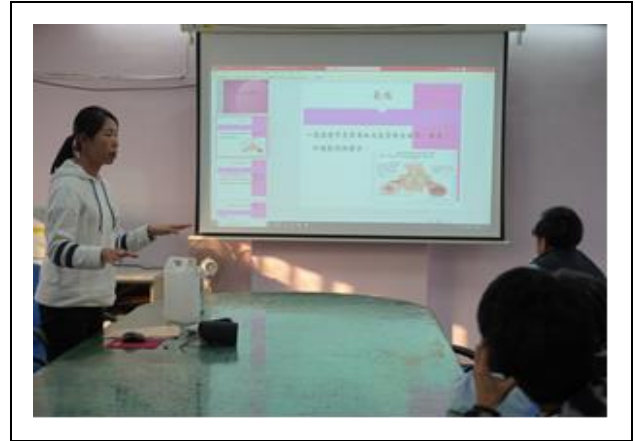
氣喘 V.S 過度換氣評估