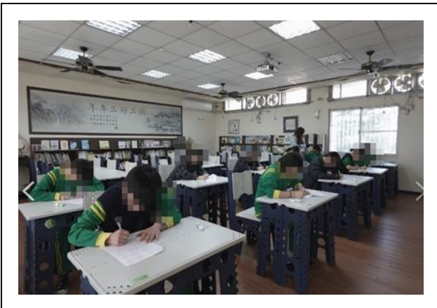
女生英文單字比賽-老師監考中