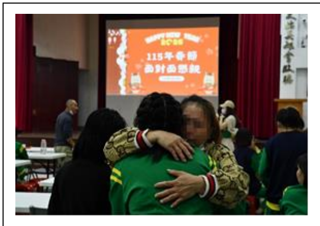
偉大母愛支持陪伴孩子成長