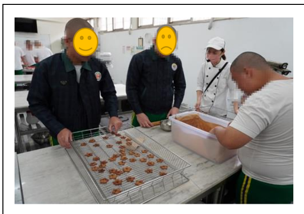
餐飲科教師帶領學生製作擠花餅乾