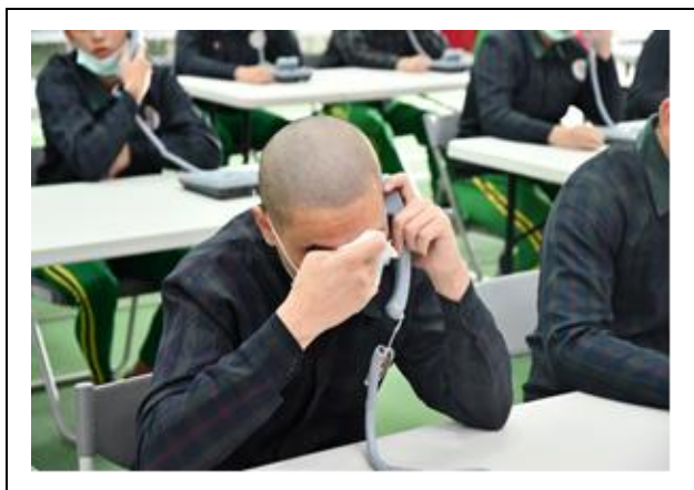
思念家人紅了眼眶