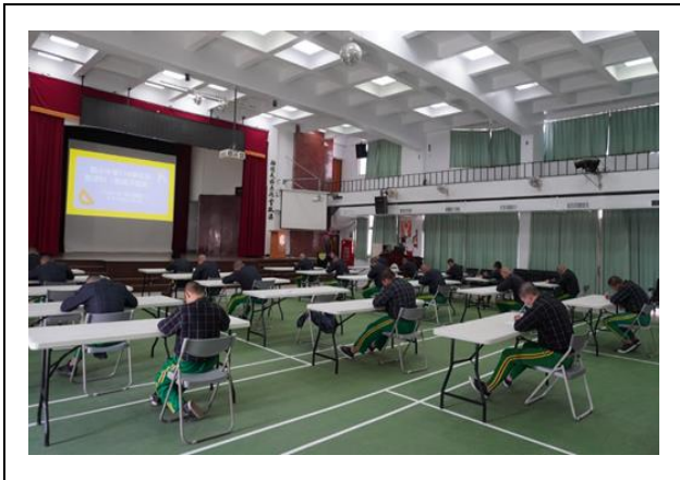
數學科數獨比賽-男生用心寫