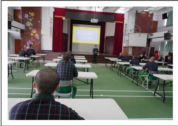
數學科數獨比賽-老師說明比賽規則