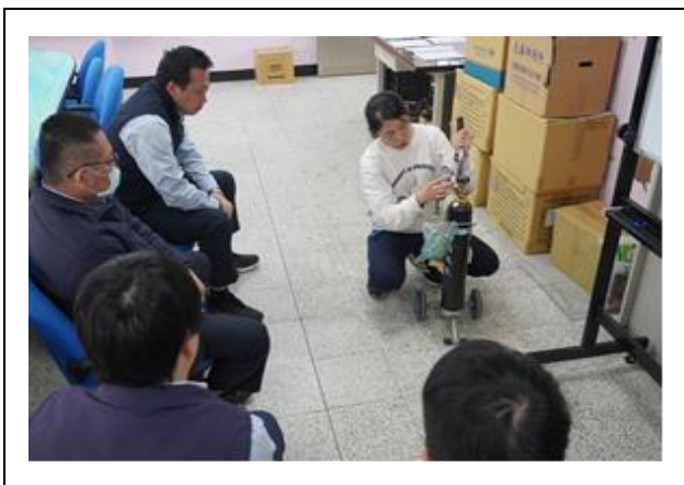
校內醫療用品使用介紹