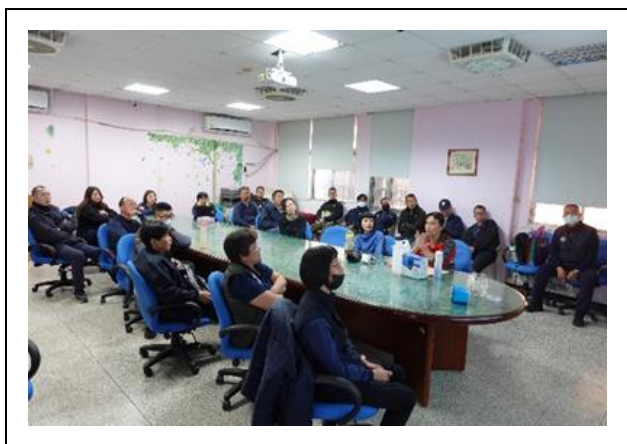
藉由課程使同仁熟悉現場評估要領