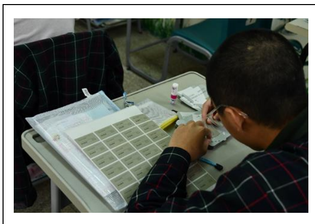
學生細心黏貼咖啡包裝標籤貼紙