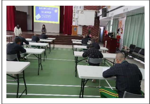
英文單字比賽-老師監考中