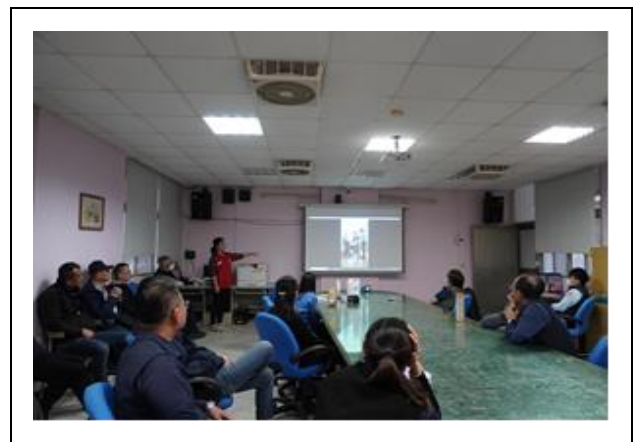
校內醫療用品使用介紹