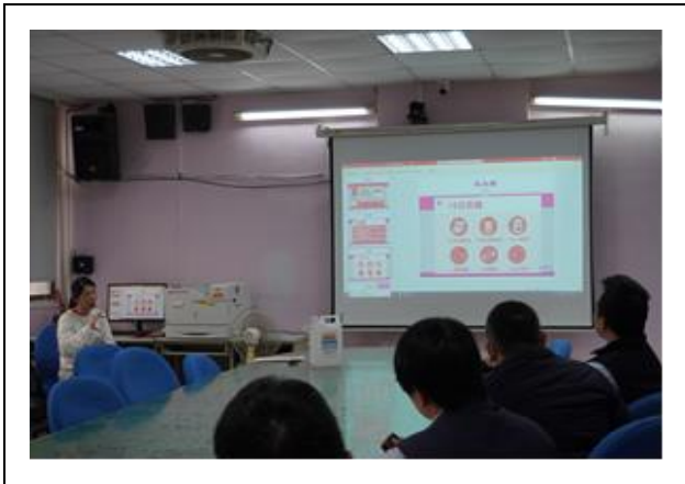
高、低血糖症狀與緊急處理方式