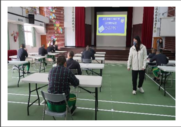
英文單字比賽-男生在中正堂