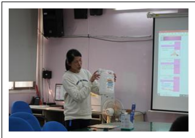
消毒桶配置方式與比例