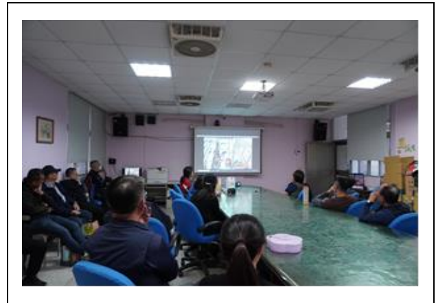
癲癇發作怎麼辦?如何給予協助