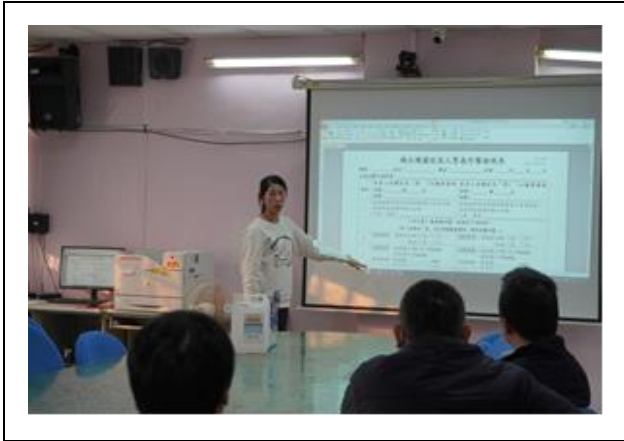
緊急外醫檢視表填寫說明