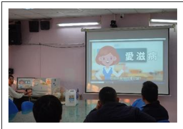
認識愛滋 PEP 與 PrEP