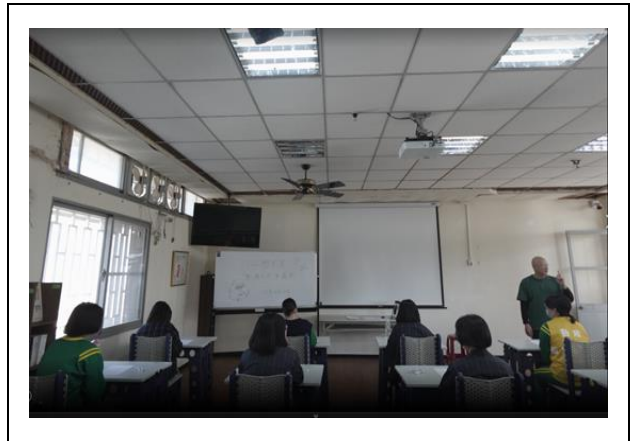
數學科數獨比賽-老師說明比賽規則