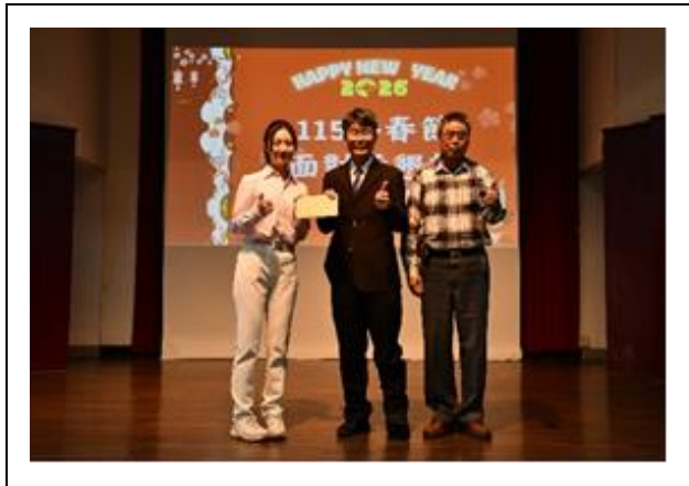
彰化縣兒童少年關懷協會蒞校鼓勵學生