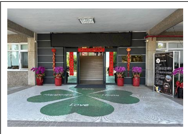
大門應景花卉及春聯