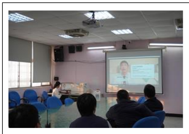
認識 PEP 與 PrEP