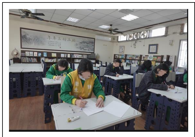
數學科數獨比賽-女生用心寫